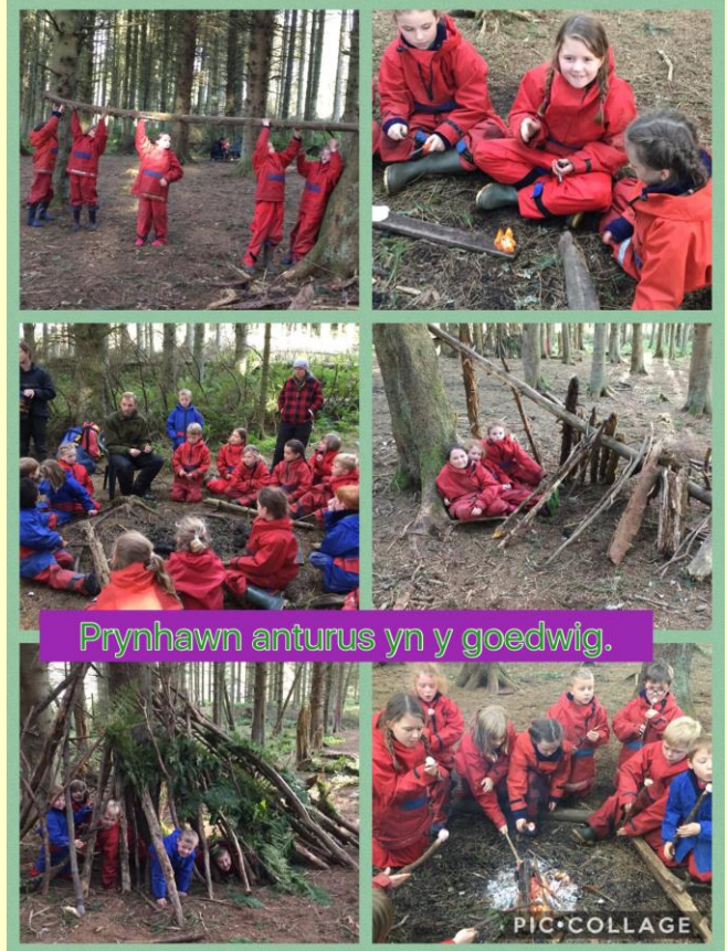
Prynhawn anturus yn y goedwig.