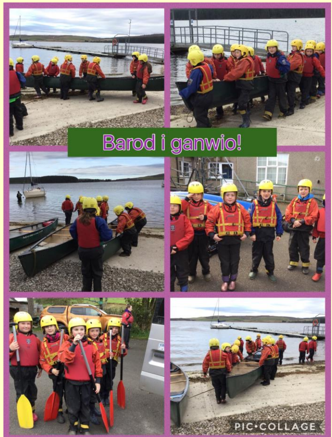
Barod i ganwio!