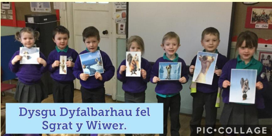
Dysgu Dyfalbarhau fel Sgrat y Wiwer.

At the beginning of a new year we organised a Growth Mindset Week in school. The children learned about the importance of working hard, persevering, learning from their mistakes and helping each other to succeed in all aspects of life. The children had fun watching Sgrat the squirrel persevering to keep hold of his acorn, learning about famous people who have overcome difficulties to get to the top and doing activities that need perseverance. Everyone set themselves a goal and learned that anything is possible using growth mindset! Follow this link to see how you can help your child at home. https://www.oxfordlearning.com/growth-mindset-tips-for-parents/