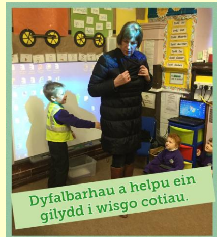
Dyfalbarhau a helpu ein gilydd i wisgo cotiau.